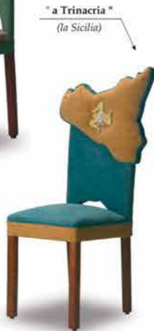
" a Trinacria " (la Sicilia)