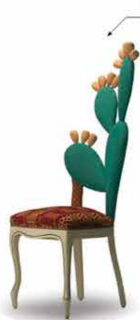
" u ficurinnia " (il ficodindia)