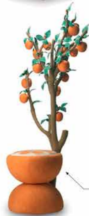
" tri llati " (trilatero)