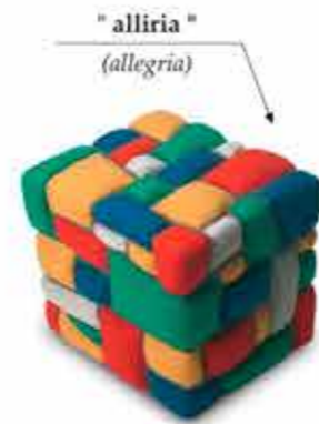
" alliria " (allegria)