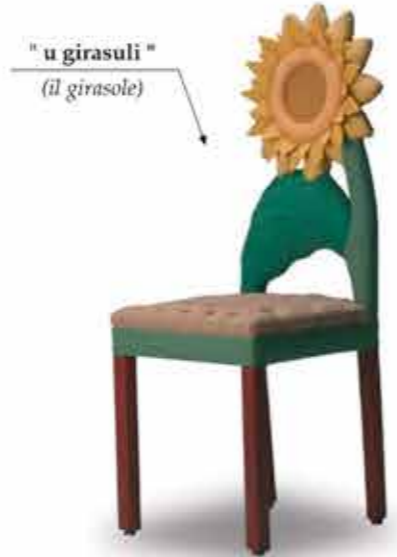
" u girasuli " (il girasole)