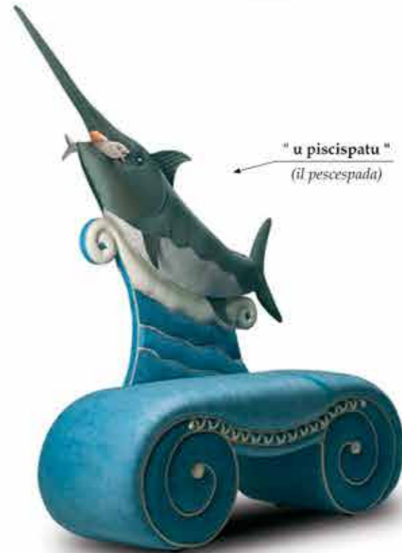
" u piscispatu " (il pescespada)