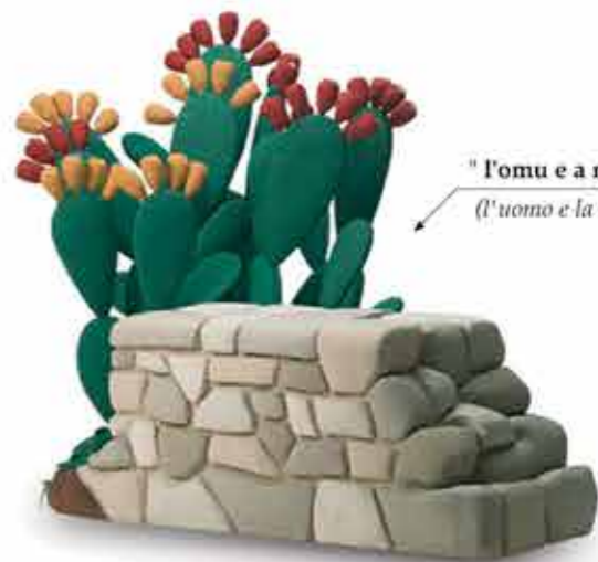
" l'omu e a natura " (l'uomo e la natura)