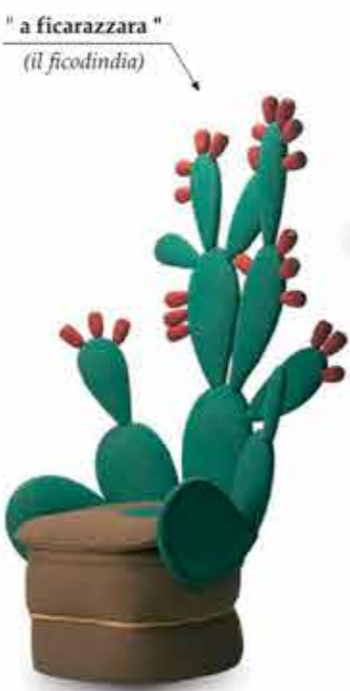
" a ficarazzara " (il ficodindia)